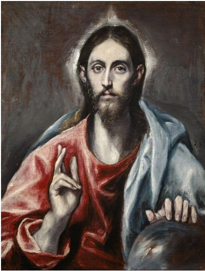
El Greco (Domenikos Theotokopoulos) - Christ Blessing ('The Saviour of the World')

Hung, một lối giải thích trong đó, lịch sử nghệ thuật và lịch sử trí thức cùng đến với nhau.