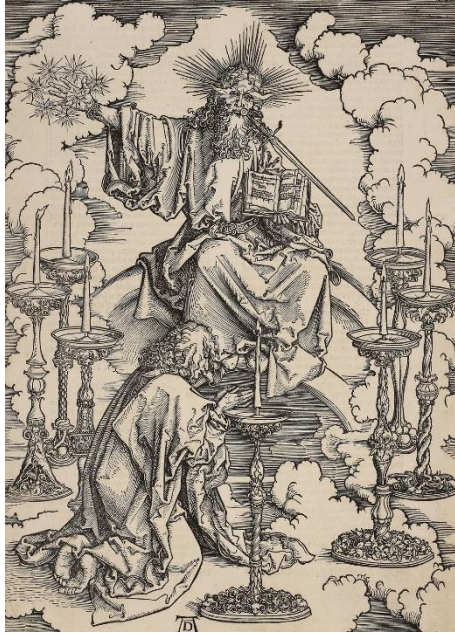
Thị Kiến Bảy Cây Đèn Nến của Albrecht Durer

Ngoại trừ một số chi tiết (như giày thay vì ‘chân giống như đồng đồ được tôi luyện’) bức tranh khắc gỗ Vision of Seven Candlesticks (Thị Kiến Bảy Cây Đèn Nến) của Albrecht Durer (thế kỷ 15), với “ý nghĩa siêu thực kỳ diệu”, trong đó, “tính ba chiều của không gian được nhấn mạnh và bác bỏ cùng một lúc” [2] trông gần như thể được dùng làm căn bản cho các lời lẽ trên của Sách Khải Huyền, hơn là ngược lại. Khuôn mặt uy nghi trong tranh khắc gỗ của Durer quả thực là Chúa của lịch sử, chủ quyền trên trời và dưới đất, vĩnh hằng và thời gian, và là cả “Alpha lẫn Ômêga, khởi thủy và cánh chung” [3] .